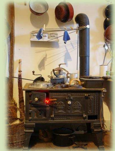
wenn sie der Mensch bewacht